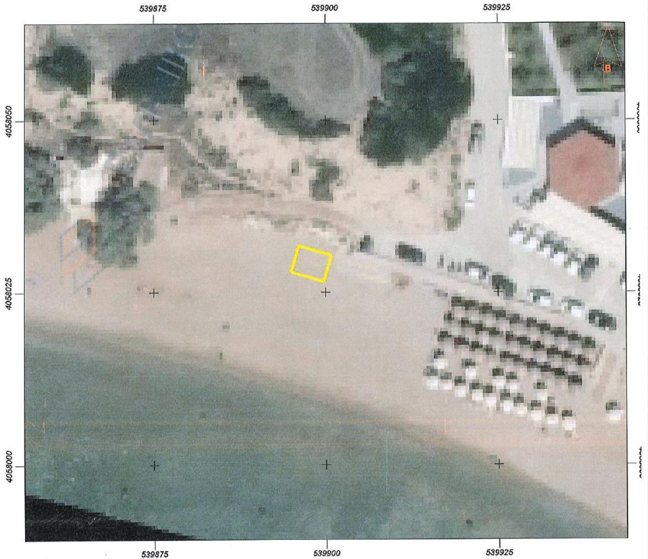
Εμβαδόν: 20.00 τ.μ.